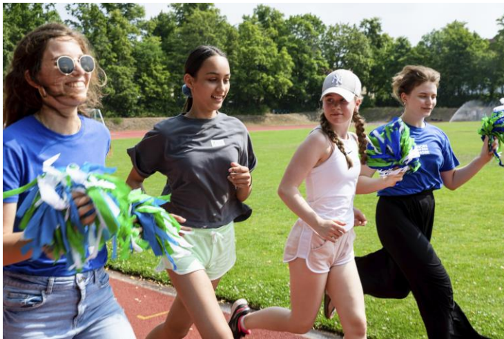
Klasse 8 beim Spendenlauf