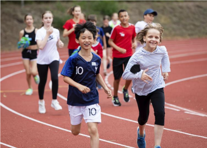
Klasse 5 beim Spendenlauf